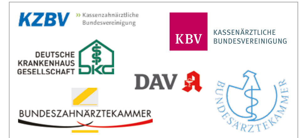
Die sechs Institutionen sind sich einig: Die Anwendung des E-Rezepts sollte erst nach ausreichender Testphase und erwiesener Praxistauglichkeit in den Regelbetrieb gehen.

Vor diesem Hintergrund haben die Kassenzahnärztliche Bundesvereinigung (KBV), die Kassenzahnärztliche Bundesvereinigung (KZBV), die Bundesärztekammer (BÄK), die Bundeszahnärztekammer (BZÄK), die Deutsche Krankenhausgesellschaft (DKG) und der Deutsche Apothekerverband (DAV) einhellig gefordert, die Anwendung des elektronischen Rezeptes erst nach einer ausreichenden Testphase und erwiesener Praxistauglichkeit für den Regelbetrieb in den Praxen vorzusehen. Denn vor dem Hintergrund, dass dort jeden Tag etwa zwei Millionen Rezepte ausgestellt werden,