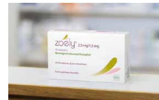
Von Lieferengpässen sind Patienten jeglicher Altersgruppen und mit unterschiedlichsten Erkrankungen betroffen.