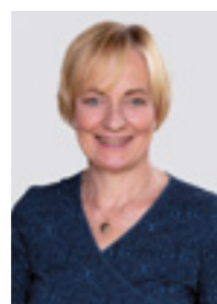
Petra Budke, Fraktions- vorsitzende der Fraktion BÜNDNIS 90/DIE GRÜNEN im Brandenburger Landtag

„Wir wollen eine Strategie entwickeln, um die ländlichen Regionen attraktiv und lebenswert zu halten. Dazu gehören gute Bildungs- und Mobilitätsangebote, der Ausbau von Internet und Mobilfunk, lebendige Ortszentren, sowie eine gute medizinische Versorgung vor Ort. Zu einem funktionierenden Gesundheitssystem gehört auch eine gute Erreichbarkeit von Apotheken. Diese ziehen sich immer weiter aus der Fläche zurück. Gemeinsam mit Apotheker*innen wollen wir daran arbeiten, die Medikamentenversorgung auch in Zukunft flächendeckend zu gewährleisten. Wir haben mit den Koalitionspartnern vereinbart, Anreize zu entwickeln, um Apothekerinnen und Apotheker für unterversorgte ländliche Regionen zu gewinnen.“